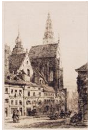
ANTWERP The Cathedral of Notre Dame