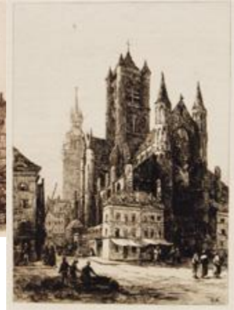
GHENT St. Nicholas and the Belfry PLATE IX