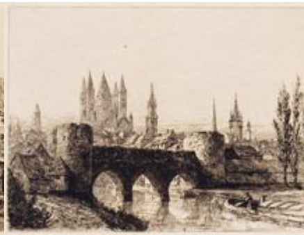
TOURNAI Ancient Bridge and City Wall PLATE XII