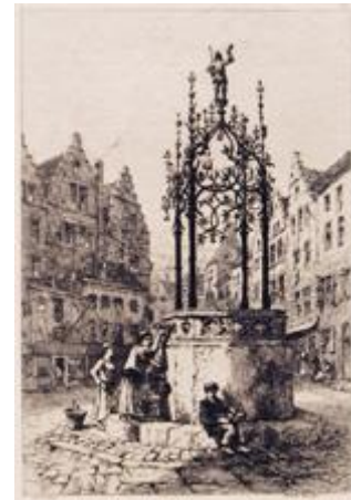
ANTWERP Well-Cover by Quentin Matsys