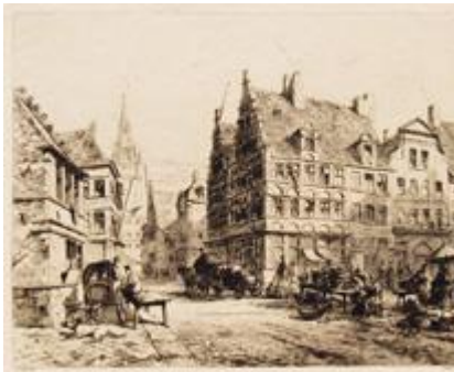
GHENT Old Houses in the Place St. Pharaïlde PLATE X