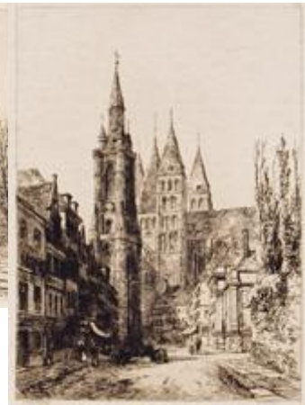
TOURNAI The Cathedral and Belfry PLATE XIII