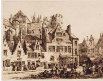
GHENT Castle of Ghent PLATE VIII