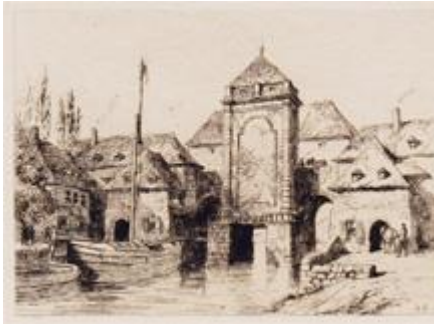
TOURNAI Bridge and Water-Gate